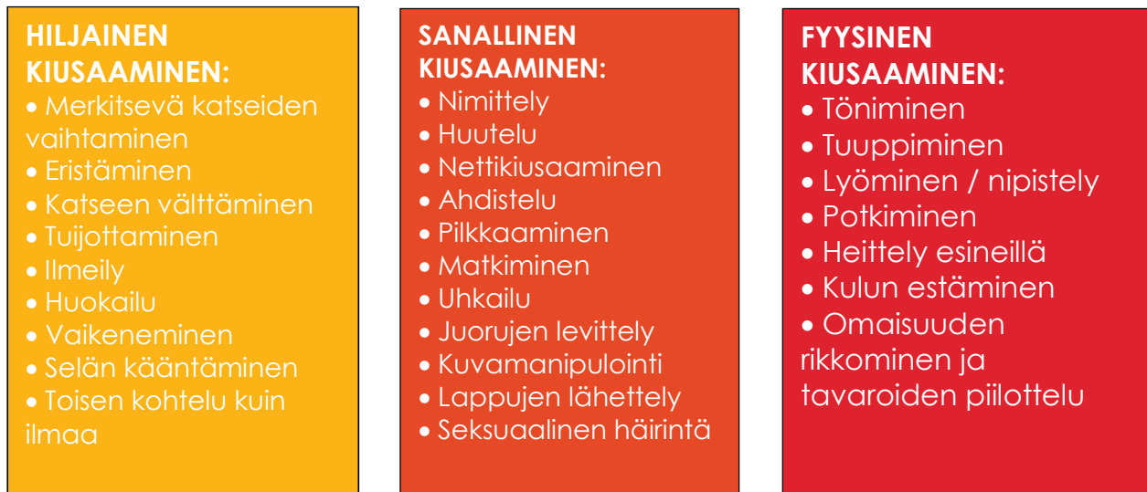
KUVA 1 Eri kiusaamistavoista

Koulussa ei voida hyväksyä asiatonta käytöstä toista ihmistä kohtaan. Voi olla vaikeaa erottaa tasavertaista riitatilannetta, fyysistä kanssakäymistä tai huulenhaittoa varsinaisesta kiusaamisesta. Aina, kun et ymmärrä, mistä ko. tilanteessa on kysymys – kysy ja ota selvää. Älä jätä asiaan puuttumatta. Etenkin hiljaiseen kiusaamiseen on vaikeaa puuttua. Tilanteiden havaitseminen vaatii ulkopuoliselta tarkkaa havainnointikykyä. On kuitenkin hyvä muistaa, että osapuolet voivat kokea nämäkin tilanteet eri tavalla.